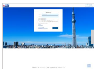
会員ログイン画面

【4】ログイン後、ホーム画面→イベント情報→第42回日本妊娠高血圧学会学術集会と進んでいただき、参加のお申し込み～決済手続きにお進みください。